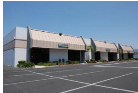
ספק מאושר של Johnson & Johnson

מערכות מידע, הנדסה, תכן, ייצור רכש, לוגיסטיקה, שירות טכני